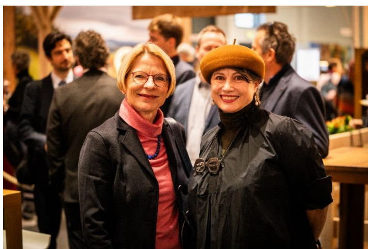
Mit der Schweizer Botschafterin Livia Leu anlässlich der Eröffnung der «Grünen Woche», der grössten landwirtschaftlichen Publikums-messe Deutschlands.