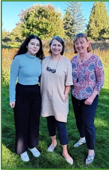
Buchpräsentation beim Hauenstein in Rafz. Die kf-Crew nimmt die Einladung gern wahr und verbringt tolle Stunden im grössten CH-Gartencenter.

Mit diversen Podien, Artikeln, Interviews, Social-Media-Posts, Runde Tische, Pressemitteilungen und nicht zuletzt mit unserem Magazin «konsum», welches nun seit über neun Jahren auch an unsere Bundesparlamentarier und -parlamentarierinnen abgegeben wird, hält das kf die Tür zur Öffentlichkeit offen. Leider sind good News, die das kf generiert, nicht interessant – nicht einmal die Eröffnung einer neuen Ombudsstelle lockt die Medien zu einer Berichterstattung, und sei sie noch so klein.